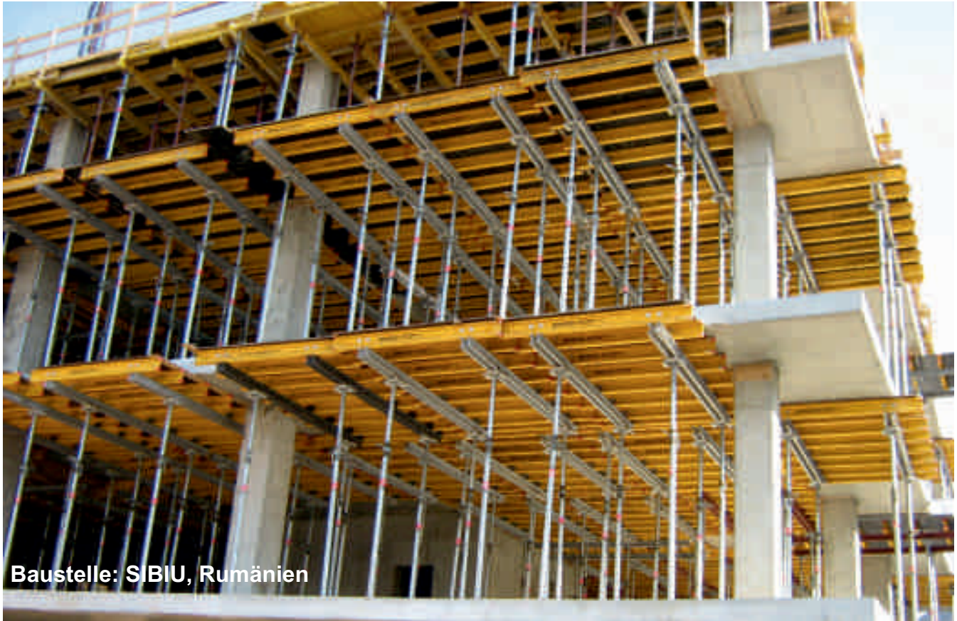
Baustelle: SIBIU, Rumänien