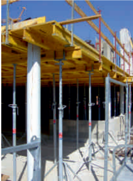
RINGER Deckenrandabschalung mit aufsteckbarem Geländer